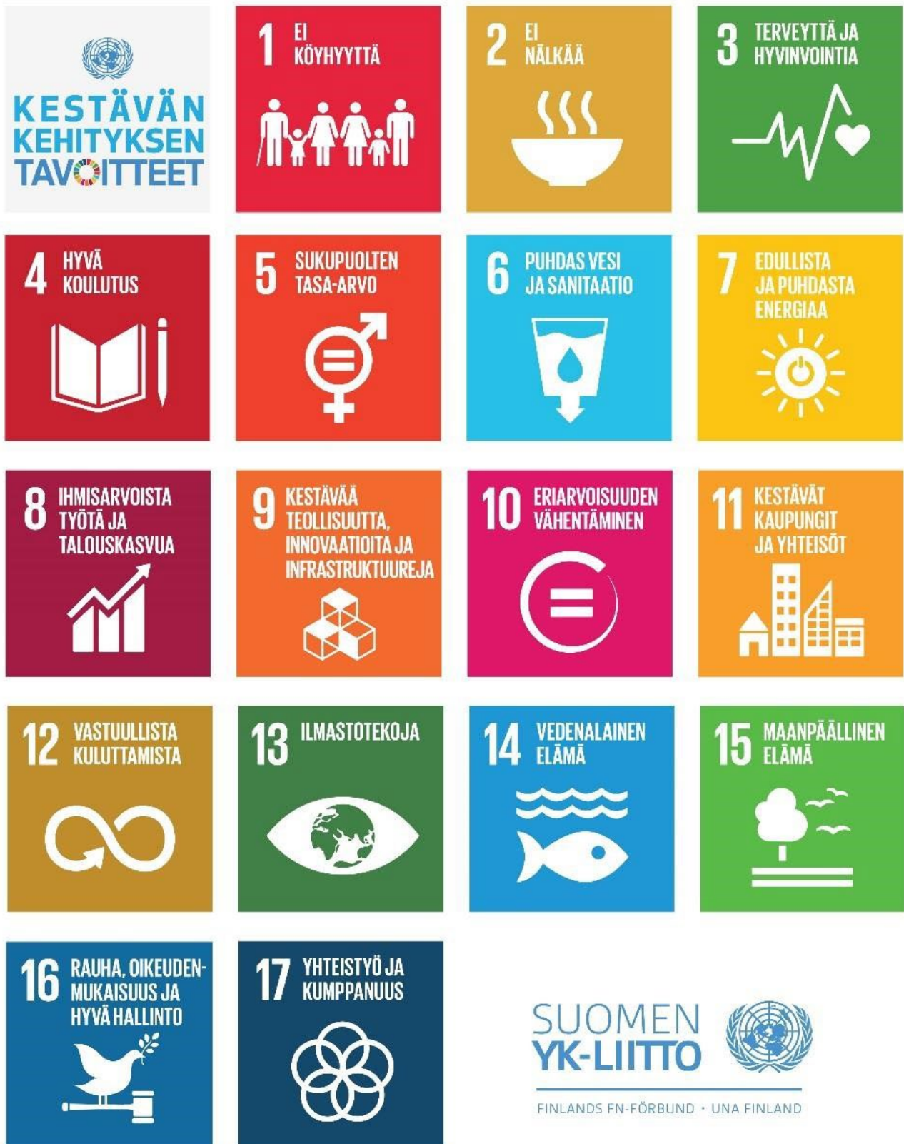
YK:n kestävän kehityksen tavoitteet vuodelle 2030. Suomen YK-liitto.