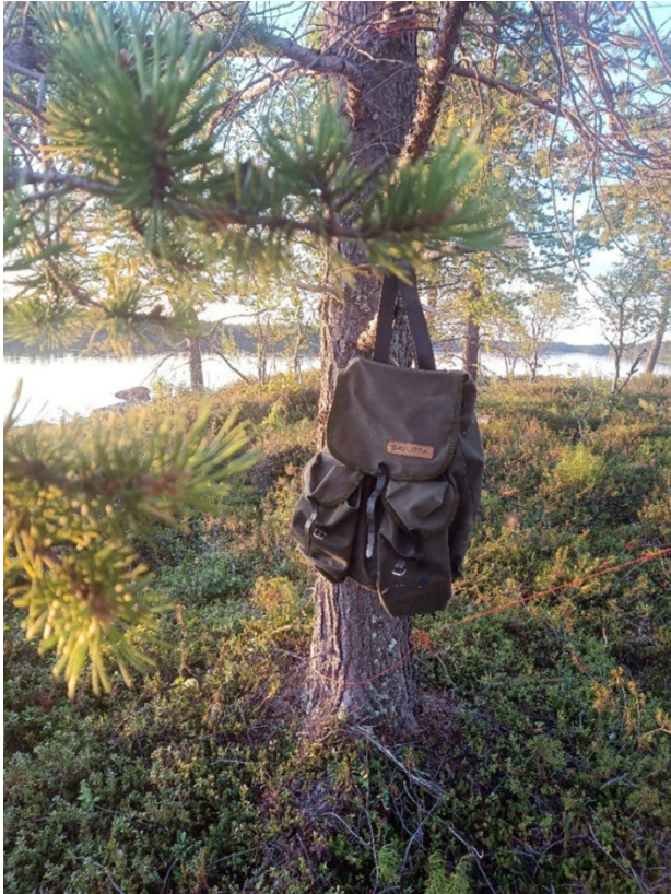
Reppu Unarin rannalla.

Yksi esimerkki konkreettisista toimituksista kestävä kehityksen teemojen edistämiseksi alueella on Enontekiön ja Sodankylän kuntien kuuluminen HINKU-verkostoon. Myös Kittilän kunnalla on työn alla oman ilmasto-ohjelman toteuttaminen.