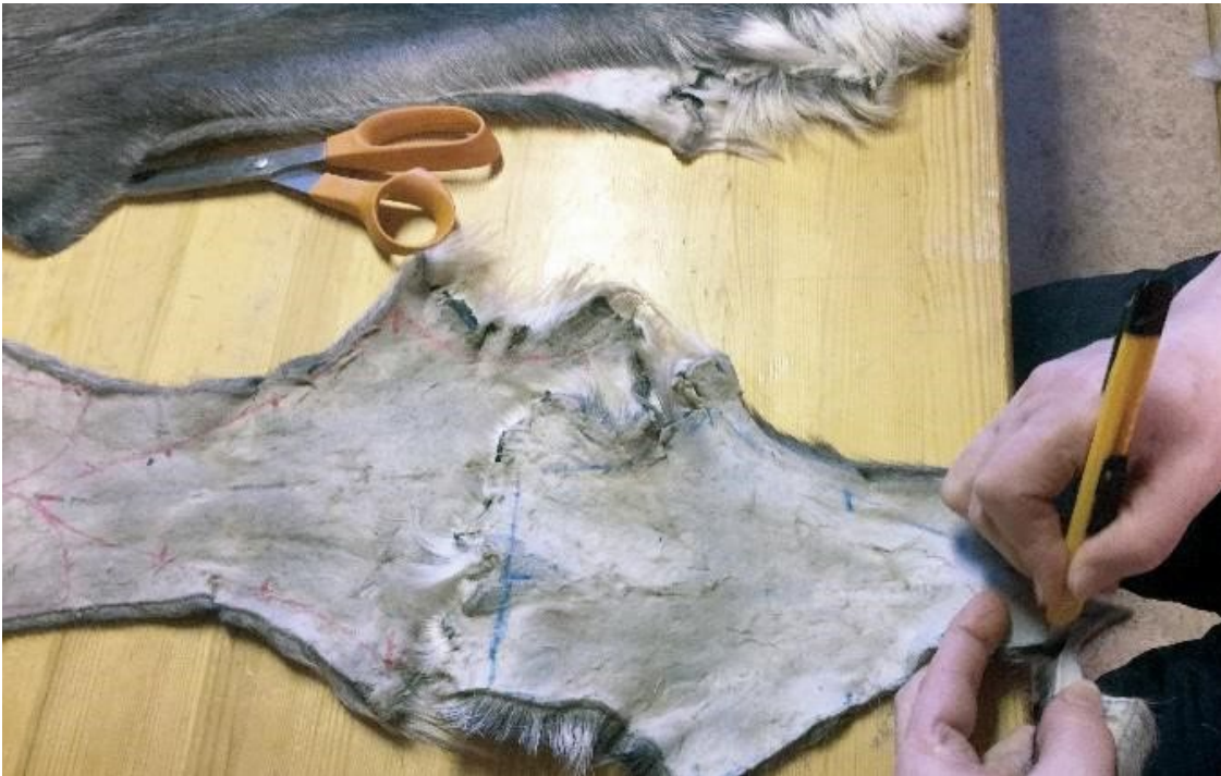
Opiston kädentaitokurssilla työn alla perinteiset nutukkaat poron kopinahoista.